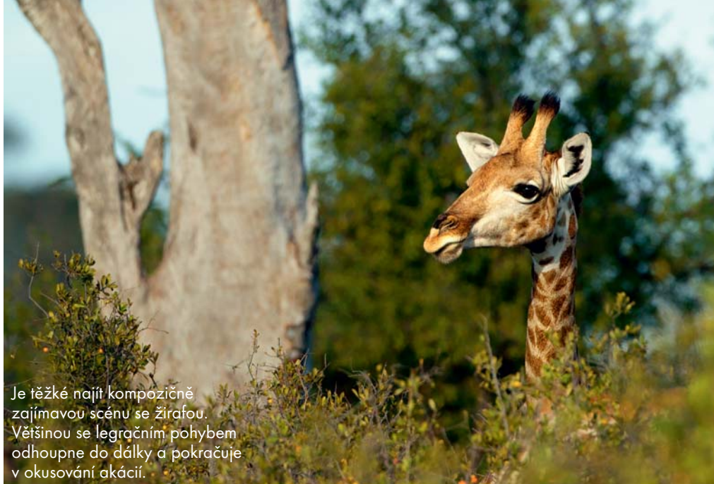
Je těžké najít kompozičně zajímavou scénu se žirafou. Většinou se legračním pohybem odhoupne do dálky a pokračuje v okusování akácií.

Mezi mladými byl nejaktivnější pes, kulhající na levou přední nohu. Překvapilo nás, jaký měl ve smečce respekt. Určitě byl zraněn v nějakém předchozím lovu, protože s vrozenou vadou by si těžko získal takovou autoritu. Pro nás fotografy byl také nejfotogeničtější. Měl jsem pocit, že to byl právě on, kdo dal ten první impuls k útoku. Možná jen vyprovokoval alfa samici, ale smečka se tryskem vydala do buše. Naše auta samozřejmě za nimi. Foťáky a stativy jsme se snažili