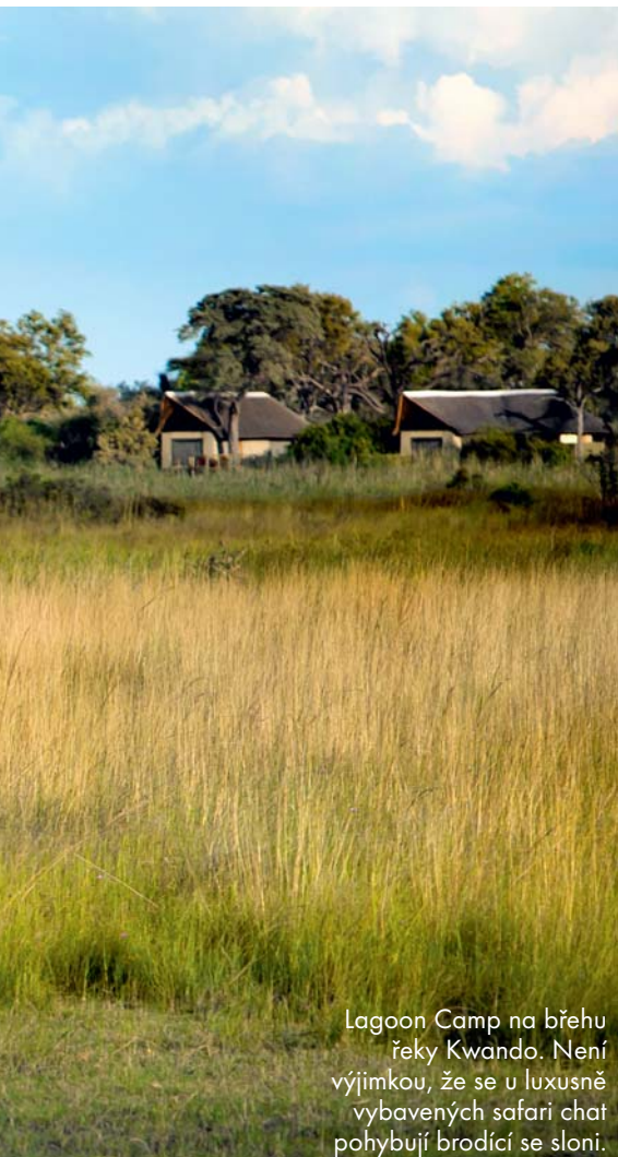
Lagoon Camp na břehu řeky Kwando. Není výjimkou, že se u luxusně vybavených safari chat pohybují brodící se sloni.

roztroušeni na ploše asi 100 x 100 metrů. Jen nepřírozeně rychlý pohyb hrudníku dával znát, že žijí. Asi po hodině čekání se „mládež“ začala postupně probouzet. Všichni se vítali, jako by se neviděli dlouhá léta. Radostné okusování a kňučení mladých dlouho nechávalo staré v klidu. Pohyb a dovádění mladých kusů se postupně zvyšovalo, přidávali se další a další. Někteří se vzdálili se vztyčenými čenichy až sto metrů od smečky. Narůstající nervozita byla jasně patrná. Vítacím rituálem postupně ožila celá smečka. Zvukové projevy svědčily o předávání posledních instrukcí před útokem.