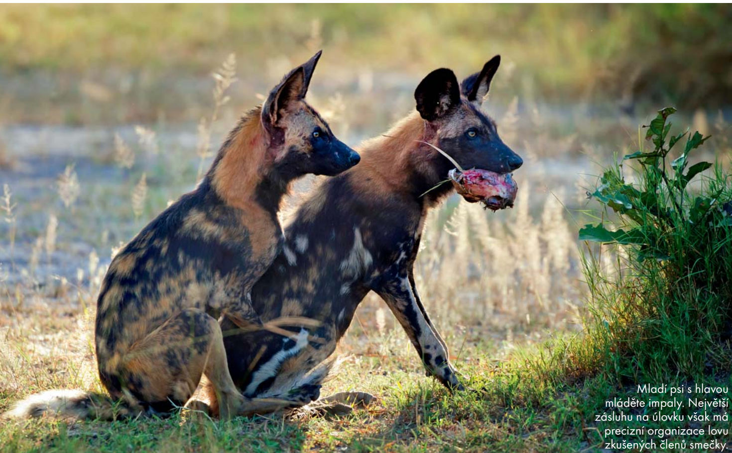
Mladí psi s hlavou mláděte impaly. Největší zásluhu na úlovku však má precizní organizace lovu zkušených členů smečky.