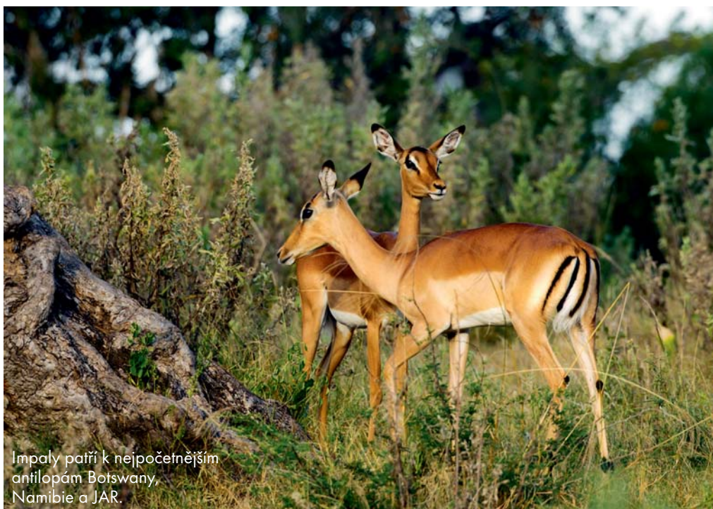
Impaly patří k nepočtenějším antilopám Botswany, Namibie a JAR.