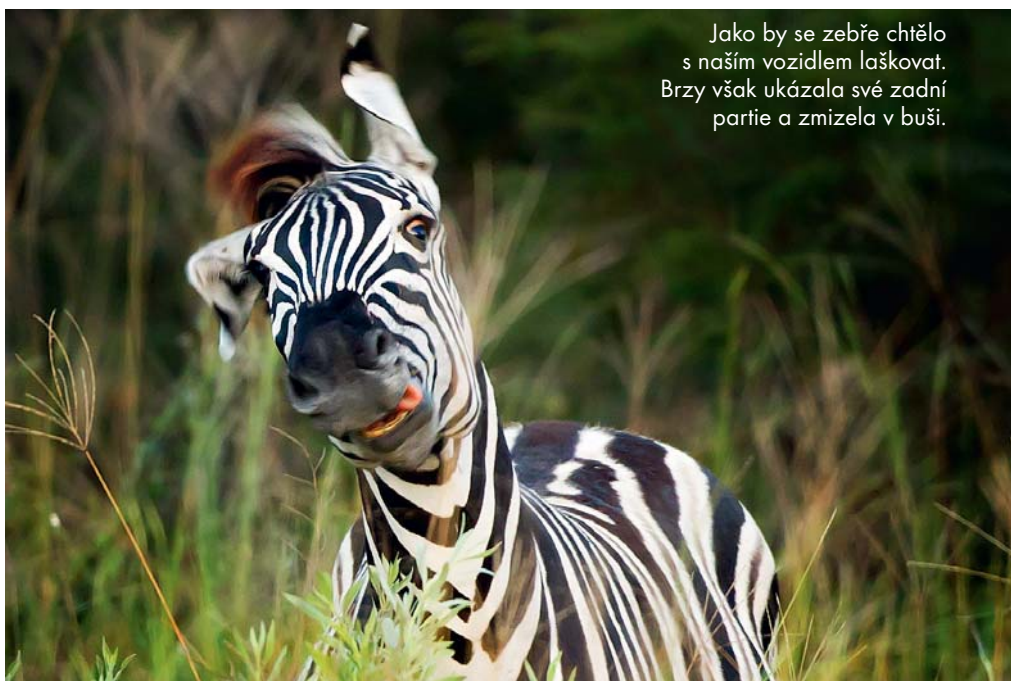
Jako by se zebře chtělo s naším vozidlem laškovat. Brzy však ukázala své zadní partie a zmizela v buši.